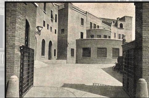
Veduta del prospetto posteriore e del cortile interno - Foto d'epoca - 1930

Riferimenti classici ed alla romanità passata si possono individuare nell'impianto basilicale del salone degli sportelli, nei pavimenti a mosaico, nelle maschere che ornano facciate e pareti interne del salone, nonché nell'autentico sarcofago del III secolo d.C. che, proveniente dai cortili del Palazzo Postale di San Silvestro a Roma, fu collocato in un ambiente adiacente al salone presso la lapide ai Caduti.